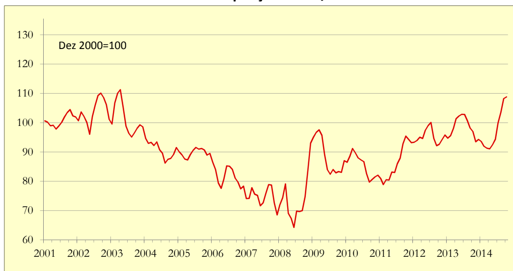
Gráfico 1: Indicador de Poupança APFIPP/Universidade Católica